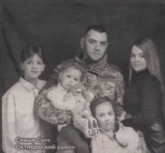
Семья Сыч, Октябрьский район