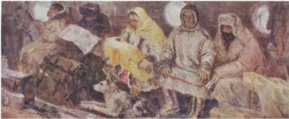
«Над снегами» 1977 г. Холст, масло