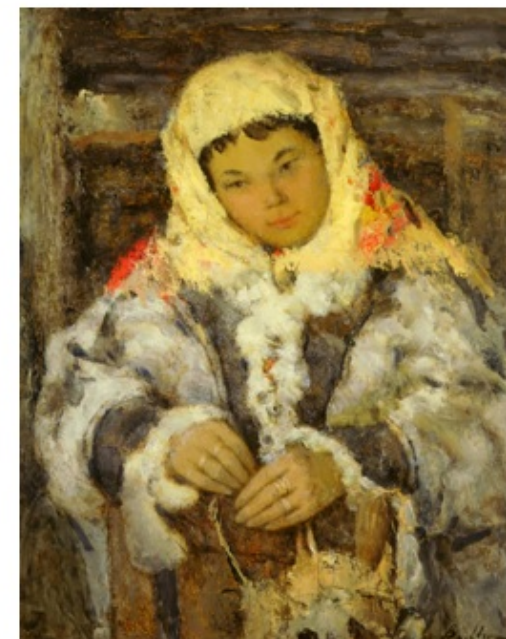
«Замечталась» 1990 г. Картон, масло