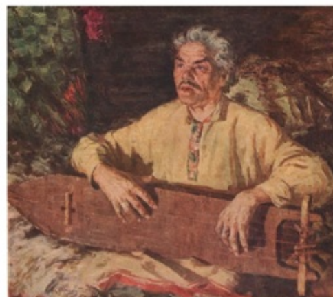
«Песня старого манси» 1956 г. Холст, масло