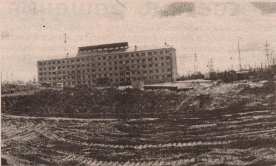
НГДУ "Мамонтовнефть", 1988 год