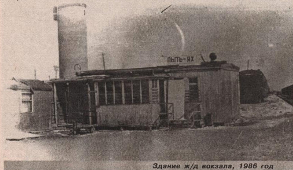
Здание ж/д вокзала, 1986 год