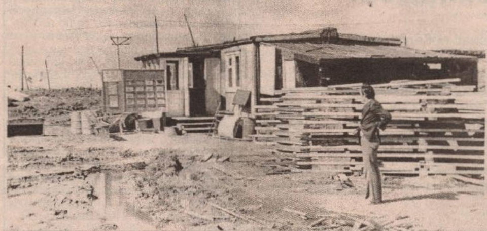
Пыть-Ях, 2 "А" мкр., 1979 год