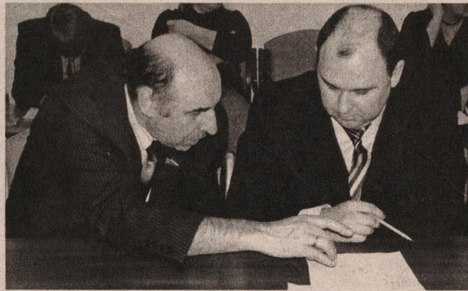
Материалы представлены пресс-службой Думы города

Также приняты к сведению отчеты об исполнении городских целевых программ: «Развитие образования», «Реализация приоритетного национального проекта в сфере здравоохранения», «Развитие молодежной политики», «Развитие физкультуры и спорта».