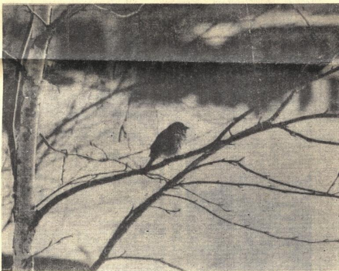
БЫТЬ ИЛИ НЕ БЫТЬ?

Все приведенные выше наблюдения сделаны американским психиатром Самюэлем Дэнкелем.