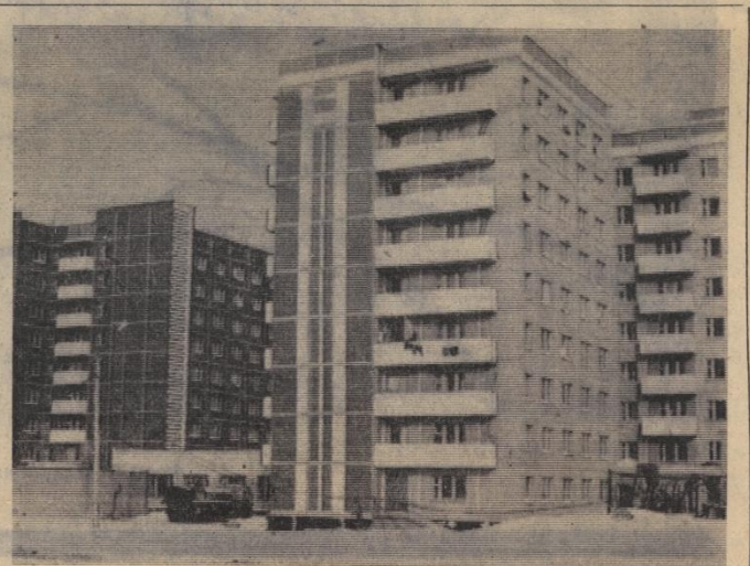
КОНТРАСТЫ Г. ПЫТЬ-ЯХА

20. Инструкция по применению Положения о порядке исчисления и уплаты налога с продаж издается Министерством финансов СССР.